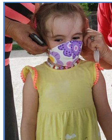
Փախստական աղջիկ Դարբնիկ գյուղի սոցիալական տանը: