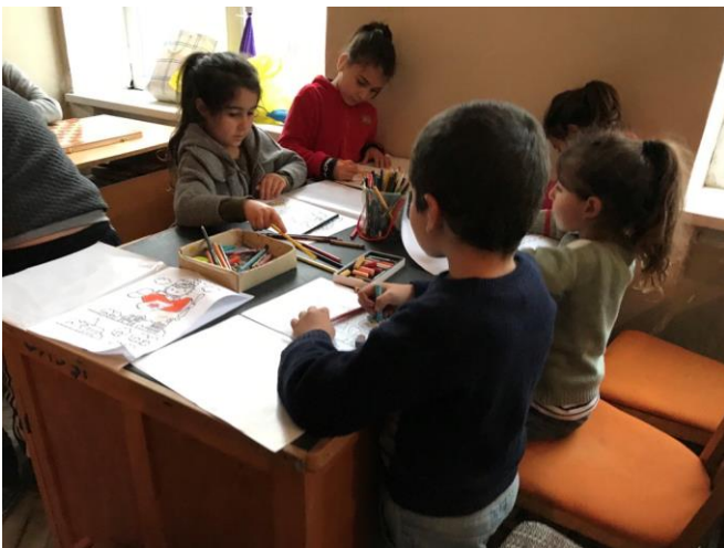
© ՄԱԿ ՓԳՀ կողմից տրամադրվող մարդասիրական օգնության մշտադիտարկում

Լուսանկարը՝ Անահիտ Հայրապետյանի, ՄԱԿ ՓԳՀ