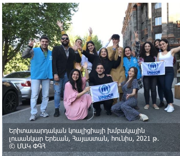
Երիտասարդական կոալիցիայի խմբակային լուսանկար Երևան, Հայաստան, հունիս, 2021 թ.