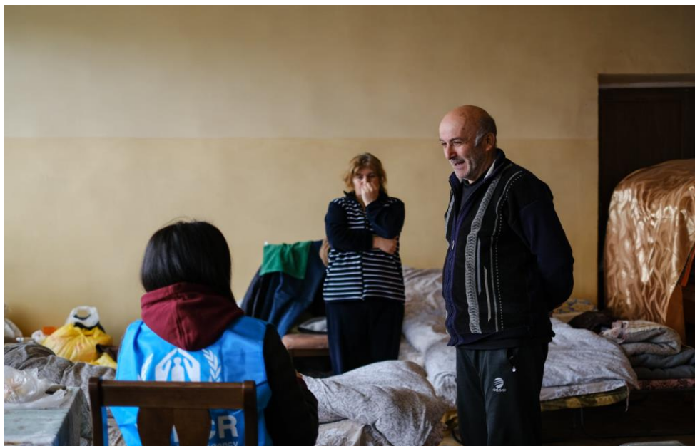
Պաշտպանության մշտադիտարկում Լեռնային Ղարաբաղից տեղահանված անձանց մոտ. Սյունիքի մարզ, ք. Գորիս, 2021 թ. մարտ:

ՄԱԿ ՓԳՅ-ն ու իր գործընկերներն աշխատում են պաշտպանության միջավայրի կատարելագործման ուղղությամբ, միեւնույն ժամանակ աջակցելով առավել ռիսկային խմբերին: ՄԱԿ ՓԳՅ-ն հանդես է գալիս ի շահ մտահոգության ներքո գտնվող անձանց ներառմանը ազգային արձագանքման ծրագրում, ներառյալ՝ COVID-19 վերականգնման եւ պատվաստման, ինչպես նաեւ այլ օրենսդրական ու վարչական բարեփոխումներում: